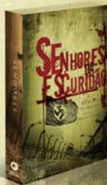
Senhores da escuridão VOLUME 2

O trabalho de magos negros e cientistas das sombras ameaçam as conquistas da civilização. Conheça o trabalho dos guardiões para fazer frente a tais investidas.